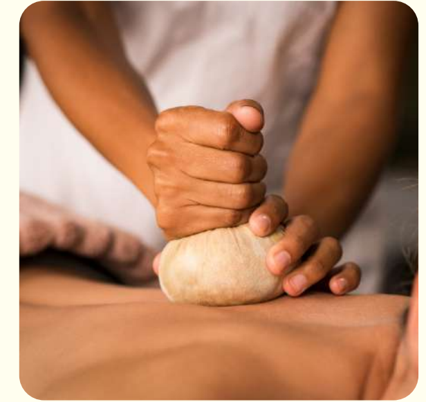
MASAJE/ VISITA AYURVEDICO