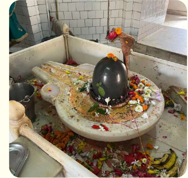
DESCUBRIR RINCONES DE LA CIUDAD