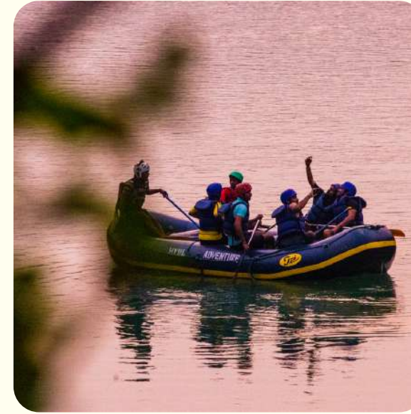
RAFTING EN EL GANGES