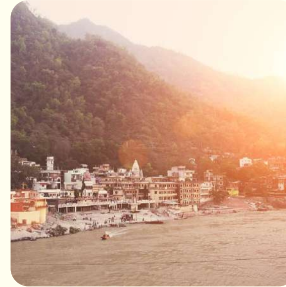
DISFRUTAR DE UN CHAI CON VISTAS