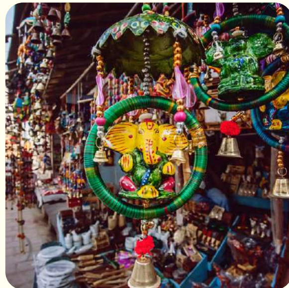
IR DE COMPRAS