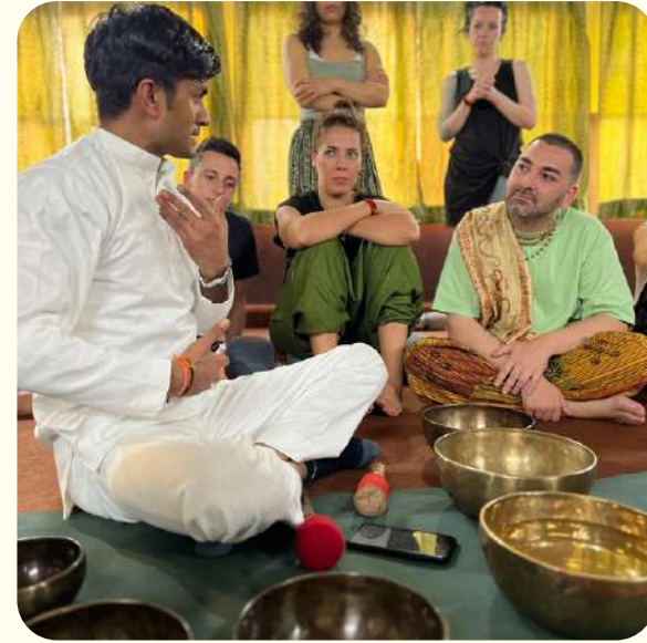
APRENDER A USAR CUENCOS